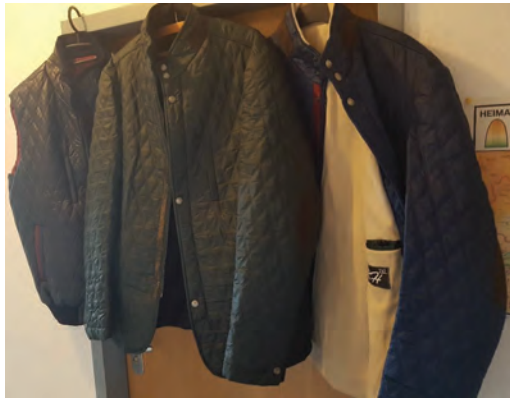
Tolle Jacken für die Übergangszeit. Dort gemacht. 20 – 25 Dollar.