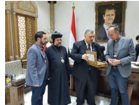
Treffen im Parlamentsgebäude

Wir trafen im Parlamentsgebäude in Damaskus auch den Parlamentspräsidenten, Hammouda Sabbagh . Er ist Christ und in der Staatshierarchie der 2. Höchste. Er begrüßte uns herzlich und betonte, dass humanitäres Engagement gerade in Homs sehr notwendig sei. Er würde uns gerne unterstützen. Gerne sollten wir bei Fragen oder Wünschen zu ihm kommen.